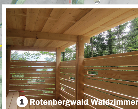
1 Rotenbergwald Waldzimmer