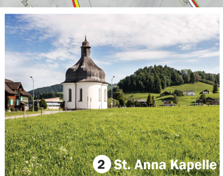
2 St. Anna Kapelle