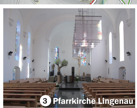
3 Pfarrkirche Lingenau